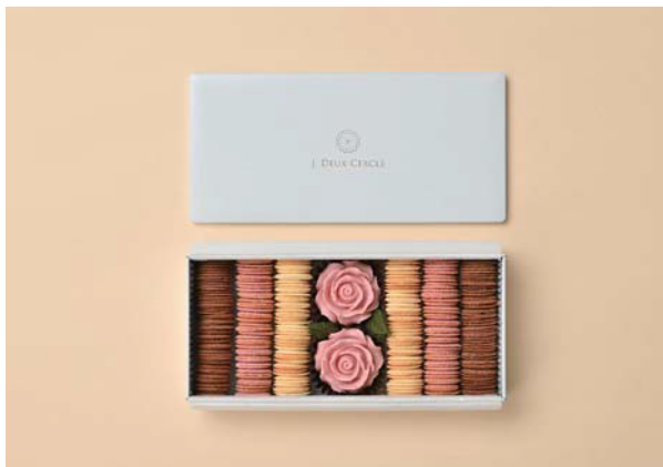
フルーリー（ローズチョコ）／J.DEUX CERCLE https://j-deux-cercle.shop-pro.jp

香料を一切使用せずに香りと味わいを自在に操る、科学者が焙煎するコーヒーブランド「虎へび珈琲」からは、ストロベリーのような香りを表現した華やかな味わいのドリップコーヒー。イタリアのライフスタイルブランド「ジノリ 1735」のパステルカラーが印象的な DIVA コレクション。カップ&ソーサーやティーポットが春のテーブルをロマンティックに彩ってくれます。この季節の引越し祝いや結婚祝いの贈り物としてもお勧めです。