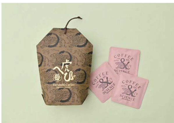
Torahebi Aged Blend Drip Bag／Torahebi Coffee https://www.instagram.com/torahebi.jp