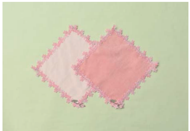
近沢レース店 シーズンタオルハンカチ 春うらら（ピンク・ピーチ）／株式会社近沢レース店 https://chikazawa-lace.co.jp