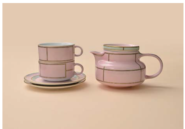
ディーヴァ ローザ ティーポット、ティーカップ&ティーソーサー／GINORI 1735 https://www.ginori1735.com/jp/ja