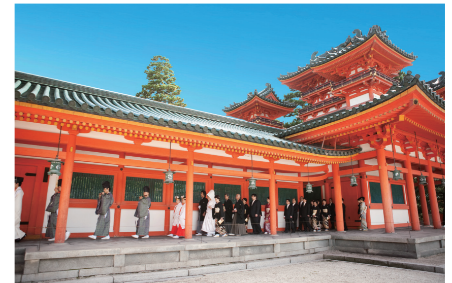
参進などのシーンでは、列席者だけでなく一般の参拝客が目にする事で結婚式への憧れを醸成する機会が多いのも神前式の大きな特徴だ

神前挙式の正しい情報をどのように伝えていくか、通訳者の必要性などの課題もあり、ハードルは決して低くないものの、訪日外国人旅行者は今後も増え続けていくことが予想されます（グラフ参照）。インバウンド客を「婚礼の新たなお客さま層」として認識し、情報発信を行なうことが、今後は当たり前となっていく。そんな神前挙式の広がり方もあっていいのではないのでしょうか。