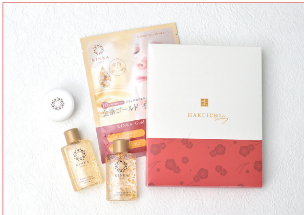
金華ゴールド スキンケアセット

日本の祝いのカラーでもある紅白を用い、梅の花や松の葉など、縁起のよいモチーフが散りばめられているパッケージデザインもポイント。お祝いのおすそ分けだということ、受け取り手にも分かりやすく伝わります。和装にも洋装の婚礼にも使える、縁起のよい引き出物となるでしょう。