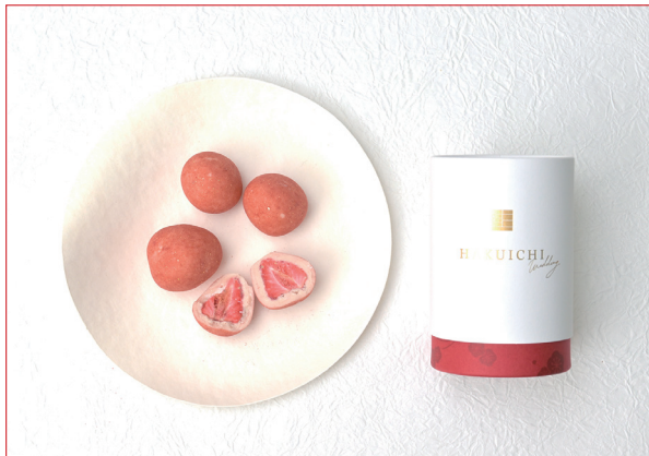
金箔 いちごチョコ