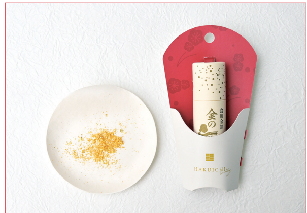
金箔ふりかけ 婚礼用